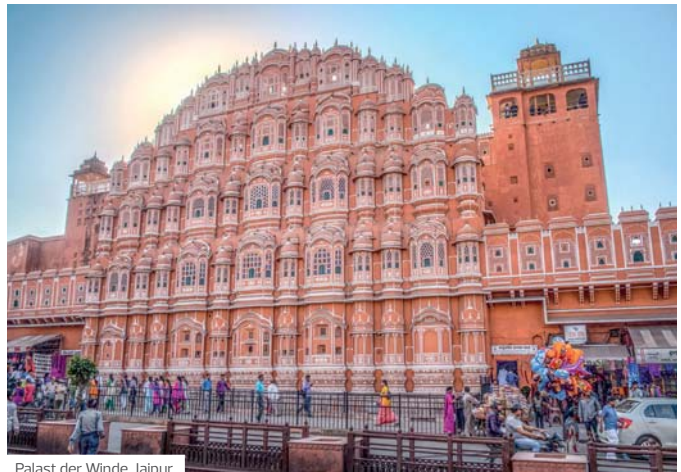
Palast der Winde, Jaipur