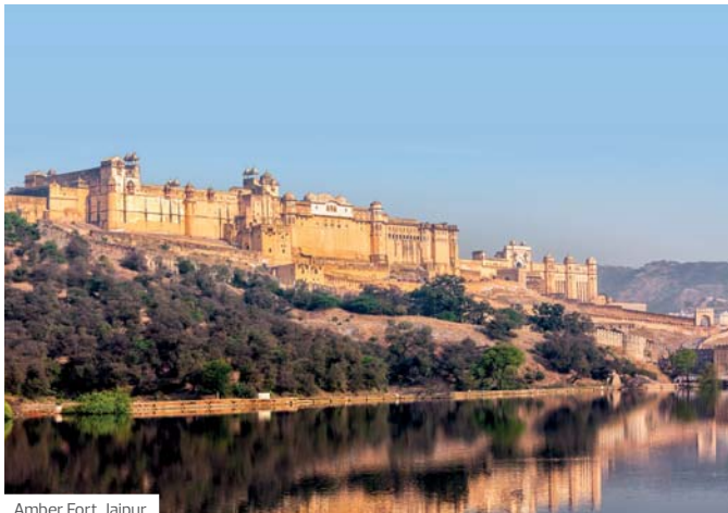
Amber Fort, Jaipur